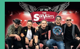
THE SERVANTS Sa., 16:30 – 19:00

Sie präsentieren sie alle, die zeitlosen, unvergessenen Rockklassiker der 60er, 70er & 80er Jahre. The Servants, 1966 in Gelsenkirchen gegründet, sind das Urgestein der lokalen Rockszene.