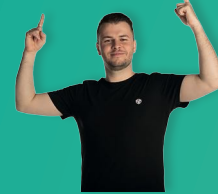
DJ ONE EAR Fr., 17:00 – 23:00

Dieser Name steht für eine einzigartige Mischung aus DJ, MC und Entertainer. Egal ob im Partystadl oder dem Megapark Dolphin am Goldstrand Bulgarien, DJ One Ear reißt jeden Gast mit seiner positiven und energiegeladenen Art in seinen Bann.