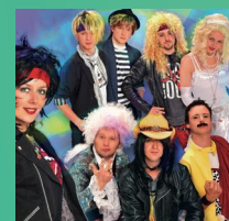
80SALIVE 80ER JAHRE Sa., 19:15 – 19:30

Vielseitig, abwechslungsreich, bunt und extrem. Mit Popperscheiteln, Vokuhilas, Löwenmähen, mächtigen Schulterpolstern, engen Spandexhosen und knalligen Neonfarben - das waren die 80er. 80s ALIVE hat sie alle zu einer großen 80er Jahre Kultshow vereint und bringt die angesagtesten Künstler dieser Zeit zurück auf die Showbühne.